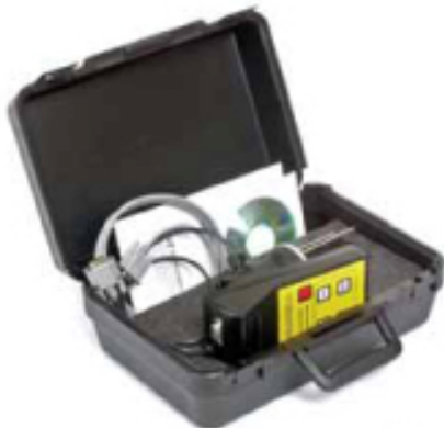
Cementometer Type L