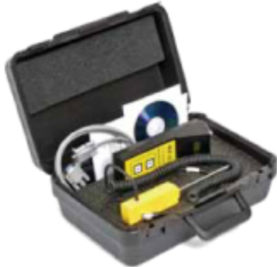
Cementometer Type R