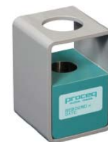
Bloque de control para PaperSchmidt