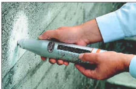
Tipo N.- El Schmidt original

Es el método de control no destructivo más extendido del mundo para este material. Ningún otro fabricante ofrece el original y un rango tan variado de tipos para pruebas y materiales específicos. Elija entre los siguientes: