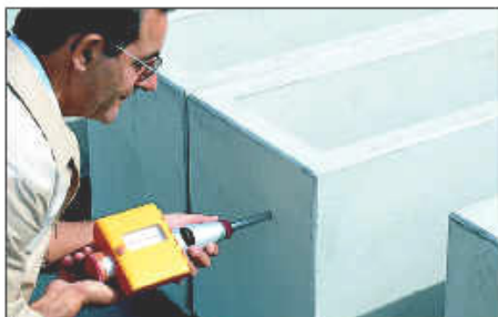
Tipo LR.- Con registro de papel encerado