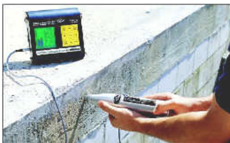
DIGI Schmidt.- Almacena y procesa datos